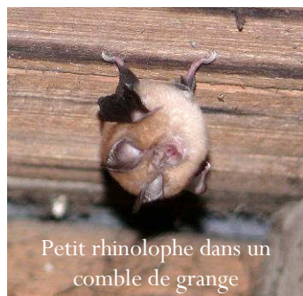
Petit rhinolophe dans un comble de grange

Les chauves-souris sont dépourvues de tout comportement constructeur et ne détériorent pas les constructions. C'est donc d'abord pour expliquer que la cohabitation avec ces animaux menacés n'est qu'à de rares exceptions près une source de désagrément pour nous, que l'association propose cet engagement aux propriétaires.