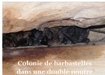
Colonie de barbastelles dans une double noure

La Bretagne accueille une diversité insoupçonnée de chiroptères (nom scientifique qui signifie "main ailées") puisque avec 21 espèces identifiées, ces demoiselles nocturnes représentent plus du quart des espèces de mammifères sauvages de la région.