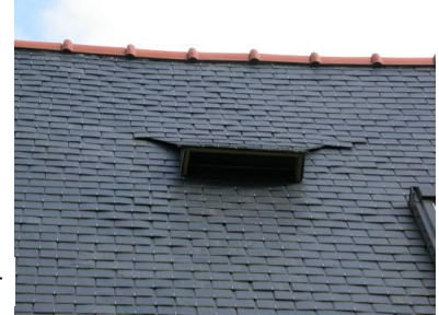
Chiroptière dans les Côtes d'Armor

Sa mise en œuvre interviendra le plus souvent à l'occasion de réfection de toitures compte-tenu de son inclusion dans le corps du toit. Cet aménagement peut constituer une solution discrète et esthétique pour ouvrir, aux chiroptères, les combles d'un bâtiment (église, habitation...).